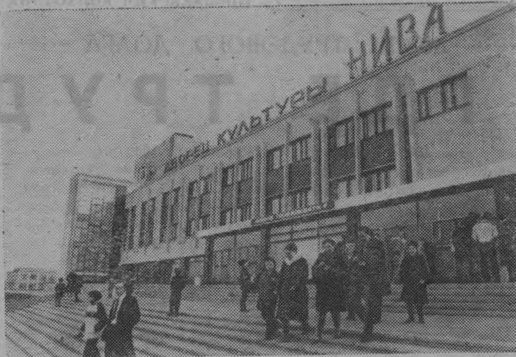
«Труженикам села — все богатства социалистической культуры» — этот девиз осуществляется во всех совхозах объединения «Детскосельское» Ленинградской области. Интересно, содержательно проводят свой досуг его рабочие и специалисты. В каждом селе и агрогородке имеется Дворец культуры или клуб, библиотека, спортивные площадки.

Сотни сельских труженников занимаются в кружках художественной самодеятельности и народного творчества. Традиционными стали коллективные выезды труженников села в музеи, театры и концертные залы Ленинграда.