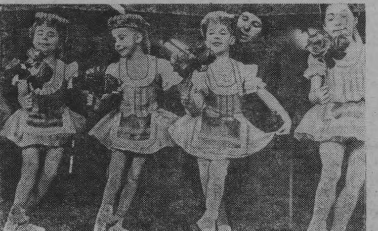
«Депсяле» («Огонек») — так называется детский коллектив классического танца при республиканском Дворце культуры профсоюзов.

Ордена Трудового Красного Знамени колхоз «Риту Аушра» Кедайнского района — экономически крепкое хозяйство с высоким уровнем механизации производства. Успешно осуществляется здесь и программа социального развития. В поселке колхоза (на снимке) есть магазин, детский сад-ясли, Дом культуры, школа, амбулатория, свой Дом отдыха.