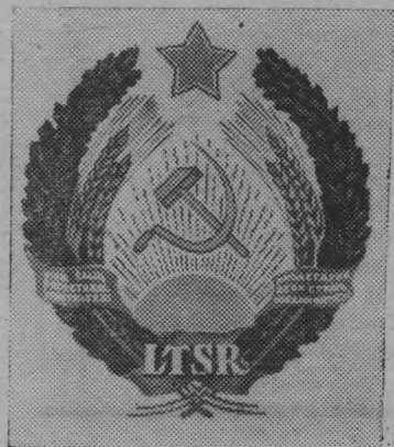
Герб Литовской ССР.

«Тщательный учет интересов и потребностей каждой нации и народности, органическое их сочетание с интересами советского народа в целом, объединение усилий трудящихся на решение актуальных задач развития общества — все это находится в центре внимания КПСС».