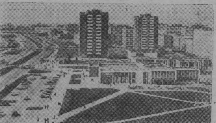
Клайпеда. Торговый центр «Дебрецен».

Совхоз имени Мичурина одним из первых в республике избавился от хуторов. Люди, жившие на отшибе, в затерянных среди болот дедовских избах, справили новоселье в домах с центральным отоплением, горячей водой, газовыми плитами. Сейчас это настоящий агрогородок, не раз выходящий победителем республиканских смотров коммунистического быта и образцового порядка.