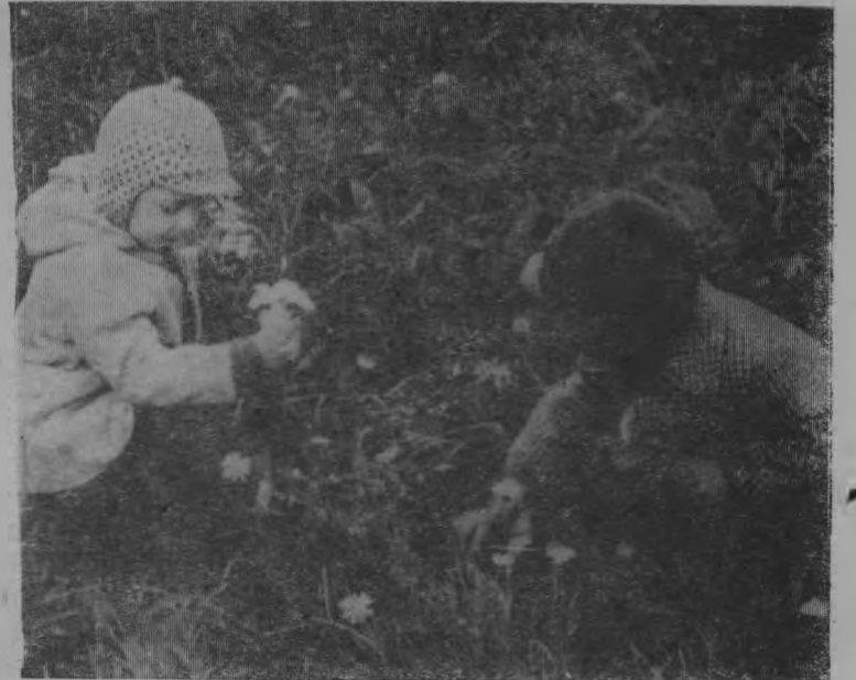
Цветы для мамы.