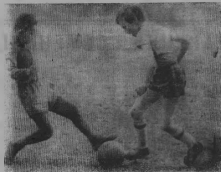
В каждом пионерском лагере в свободное время мальчишки играли в футбол. Часто они устраивали соревнования, в которых участвовали отрядные команды.

Однако простые труженики «Бритиш рейл» не намерены мириться с таким откровенным попранием их права на труд. С начала года они провели серию выступлений, крупнейшим из которых стала забастовка машинистов поездов, объединившая 25 тысяч человек. Массовая демонстрация рабочих и служащих состоялась в Суиндоне, где в связи с решением администрации «Бритиш рейл» оказались под угрозой увольнения 1,5 тысячи железнодорожников. Демонстранты выразили гневный протест против этого решения. Антирабочую позицию руководства компании решительно осудили компартия Великобритании, лейбористская партия и профсоюзное движение страны. (ТАСС)