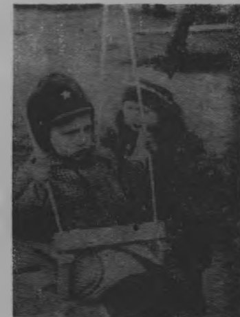
На качелях