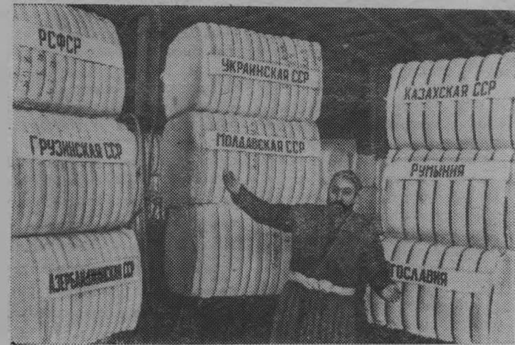
На снимке: «белое золото» Таджикистана—братским республикам.

В. И. Ленин завещал «...идти непременно дальше, добиваться непременно больше...» Наполненные высоким смыслом ленинские слова рожают трудовой энтузиазм и вдохновение, которые отражены в делах и планах партии и народа.