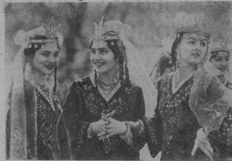
«Зебо» в переводе с таджикского значит красивая. Так называется женский танцевальный ансамбль, созданный при республиканском комитете по телевидению и радиовещанию республики. В его репертуаре около сорока оригинальных хореографических композиций. Зрители тепло встречают каждое выступление ансамбля.

Сейчас в медицинских учреждениях трудятся около восьми тысяч врачей и втрое больше медиков со средним специальным образованием. В республике создан институт материнства и детства, открыт республиканский кардиологический центр, другие специализированные службы. Возводятся медицинский городок, научный центр, институт гастроэнтерологии.