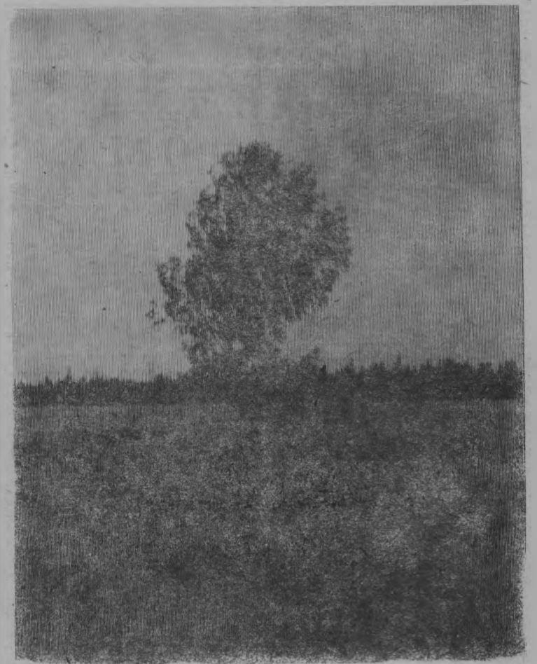
Шумит береза на ветру.