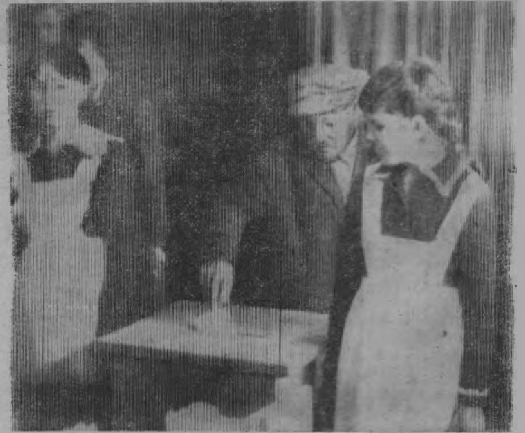
Избирательный участок в п. Шайгино.

Проголосовав за своих кандидатов в депутаты, Кировчане убедительно подтвердили свою горячую поддержку аграрной политики КПСС.