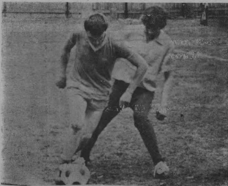
На снимке: автор забитого мяча в матче Шайгино—Тоншаево