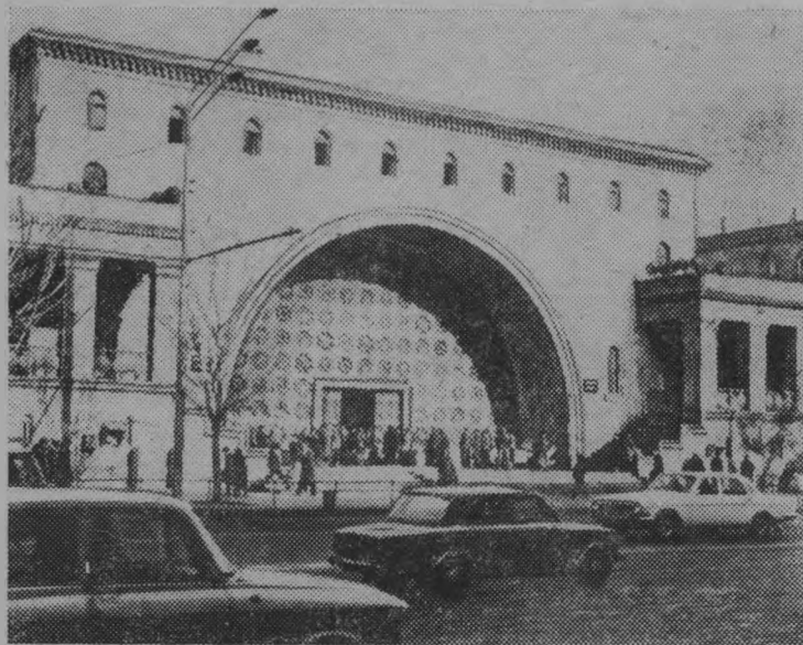
Центральный колхозный рынок в Ереване.

Это уже потом, освобожденная из каменного плена, земля расцветает нивами и садами. Так преобразился тот же Талинский район. Базой переехав стал Ноемберянский район. Сады-террасы, орошаемые многоступенчатыми насосными станциями, поднимаются все выше и выше в горах Иджеванского района, Зангезура, в предгорьях Араратской долины.