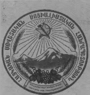
Герб Армянской ССР.