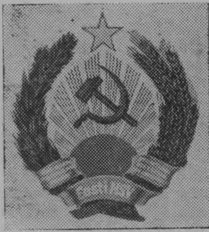
Герб Эстонской ССР