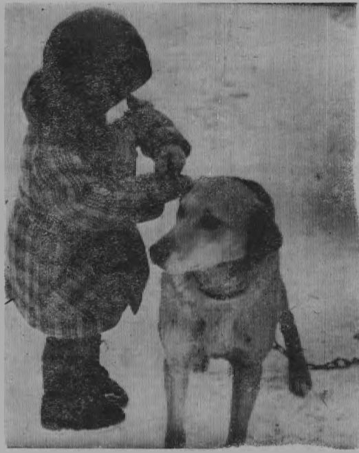
Разрешите познакомиться.