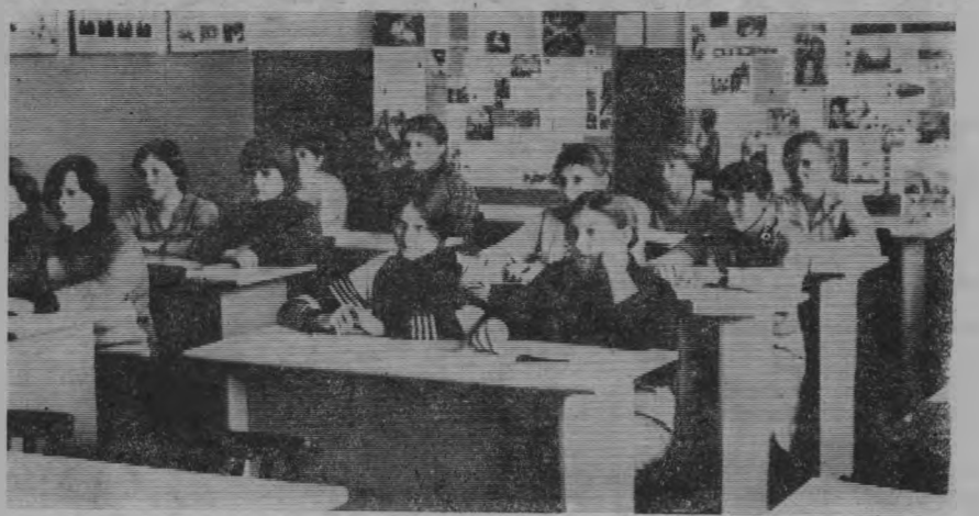
Третий год работает в Шахуне учебно-производственный комбинат трудового обучения и профориентации учащихся (УПК). В текущем учебном году обучение проходит по шести профилям. За два года в УПК прошли обучение 485 выпускников, из них 227 получили рабочие разряды. На снимке: в учебном кабинете.

НАШ коллектив, как и все советские люди, горячо воспринял решения XVII съезда профсоюзов СССР и выступление на нем Генерального секретаря ЦК КПСС Л.И. Брежнева. Документы съезда мы взяли на вооружение и используем их в своей повседневной организационно-массовой и производственной деятельности.