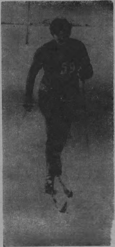
На снимке: одна из участниц на дистанции.