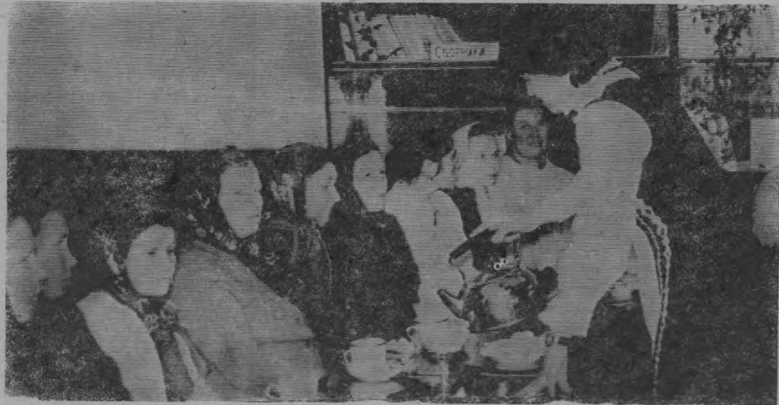
На снимке: Ведущая вечера угощает гостей чаем.