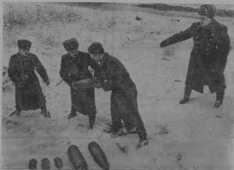
Краснознаменный Прибалтийский военный округ. Мигающий маячок милиционерской машины заставляет оста-

Необходимо разработать мероприятия, обеспечивающие устранение допущенных недостатков по выполнению плановых заданий. Максимально использовать имеющиеся резервы по своевременной сдаче объектов. Особое внимание обратить на качество произведенных работ и на улучшение экономических результатов.