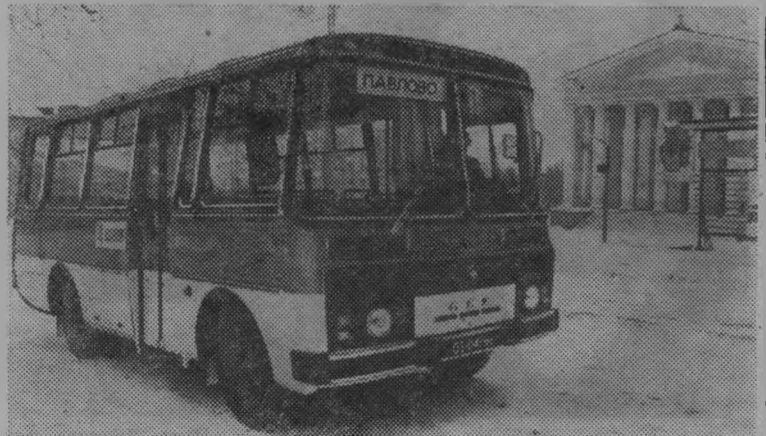
Горьковская область. На Павловском автобусном заводе выпущена первая партия машин нового класса «ПАЗ-3205» (на снимке). У них улучшена обзорность, удобнее scomпанованы сидения.

Именно Лондон поставил протестантов в привилегированное положение и насадил режим угнетения католиков, потому что больше всего опасается создания единого фронта католиков и протестантов в борьбе за свои права.