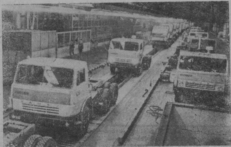
На снимке: участок сборки шасси главного конвейера КамАЗа.