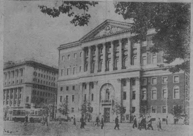
Здание Моссовета на Советской площади.

«Дорогая моя столица, Золотая моя Москва».