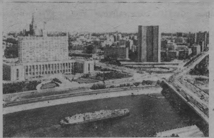
Москва. Вид на Дом Советов РСФСР и здание СЭВ.

Гармонично развиваются все народы и народности, все национальные республики, входящие в состав РСФСР. Так на деле реализуется важнейшее требование ленинской национальной политики о ликвидации унаследованного от прошлого фактического неравенства наций.