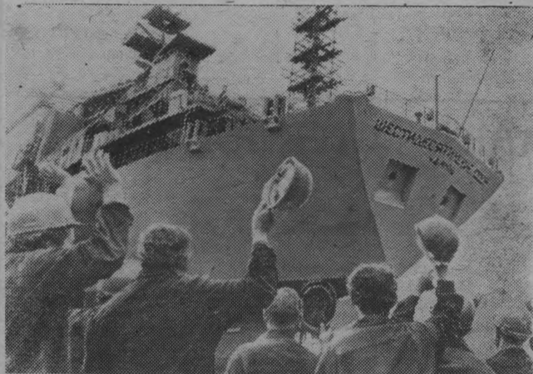
Спуск на воду нового океанского теплохода с горизонтальным способом грузообработки, строительство которого ведет коллектив завода имени А. А. Жданова (Ленинград).

Байкало-Амурскую магистраль строят вся страна.