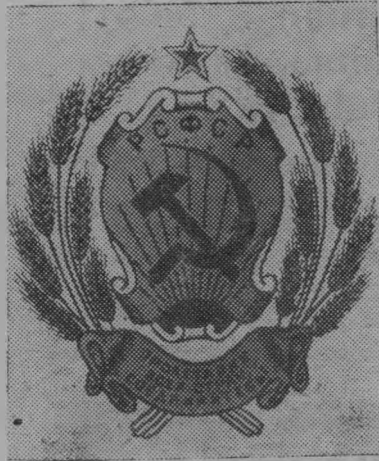
Герб Российской Советской Федеративной Социалистической Республики.