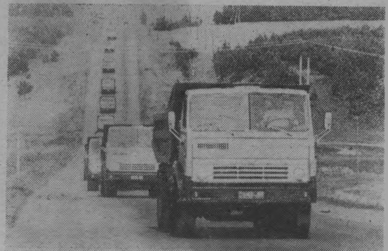
Ведущей отраслью современной индустрии РСФСР является машиностроение: около 100 тысяч наименований машин и механизмов выпускается сейчас в республике.

На снимке: колонна автосамосвалов, рожденных в содружестве машиностроителей Татарии и Башкирии.