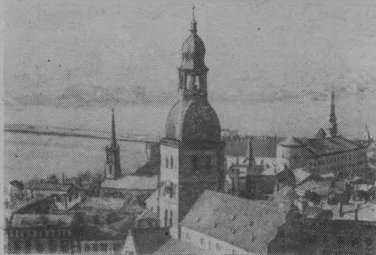
Рига — столица Латвийской ССР.

(Из постановления ЦК КПСС «О 60-й годовщине образования Союза Советских Социалистических Республик»).