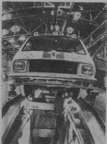
Сборочный конвейер Елгавского завода микроавтобусов «РАФ» имени XXV съезда КПСС.