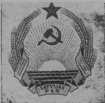
Герб Латвийской ССР.

«В дружной семье народов динамично растет экономика всех советских республик. Современная промышленность, сельское хозяйство, наука, подлинный расцвет культуры — вот что характеризует сегодня любую из них».