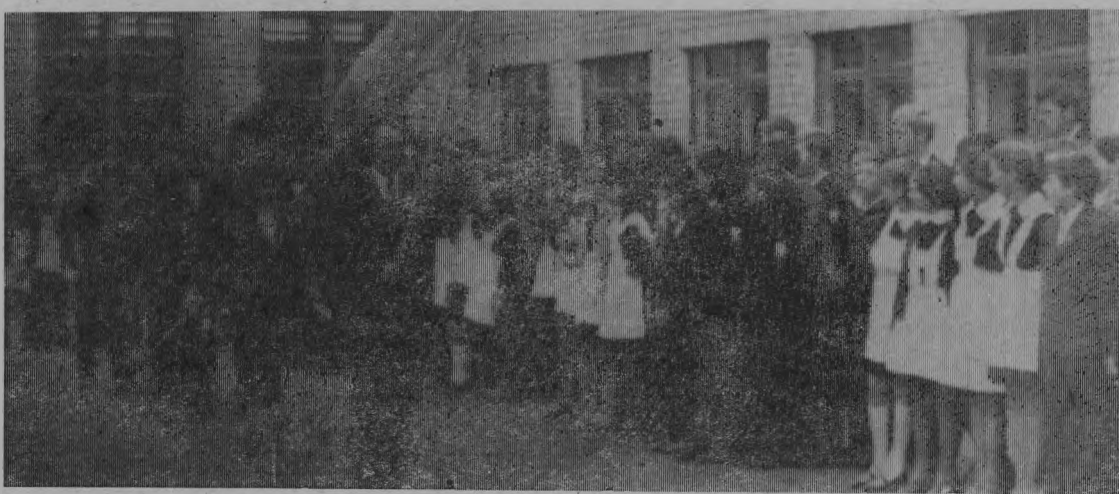
На снимке: торжественная линейка в Тоншаевской средней школе.

В. ЖУРАВЛЕВ, председатель райспорткомитета.