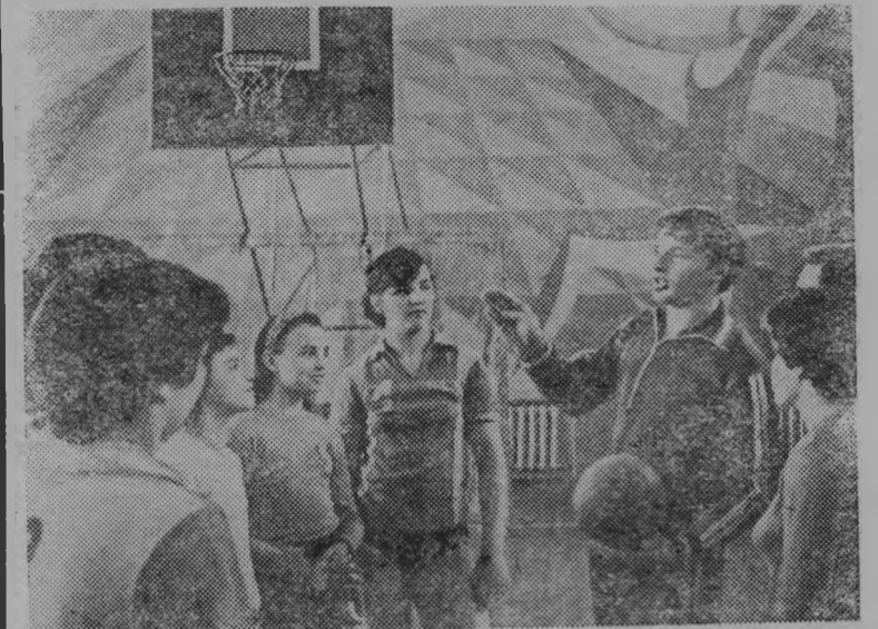
Ежегодный праздник молодости и здоровья, красоты и ловкости — Всесоюзный день физкультурника отмечается всем советским народом. В этот день на стадионах и спортивных площадках, во Дворцах спорта и бассейнах, на велотреках и теннисных кортах проходят различные спортивные соревнования.

XXVI съезд КПСС поставил задачу дальнейшего развития физкультуры и спорта в стране, широкого внедрения их и повседневно быт советских людей.