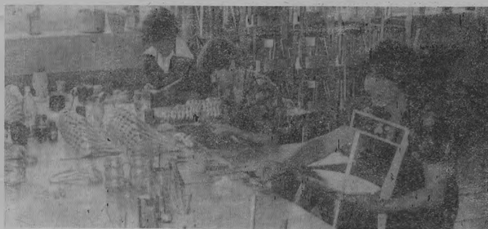
Художественный цех Шарангского завода сувениров. Здесь под руками мастериц рождаются узоры золотой хохломы. Деревянные ложки, детские стульчики, наборы росписной посуды, яркие и царящие, пользуются большим спросом у покупателей. Продукция шарангцев идет в Москву, Ленинград, Прибалтику, Молдавию.