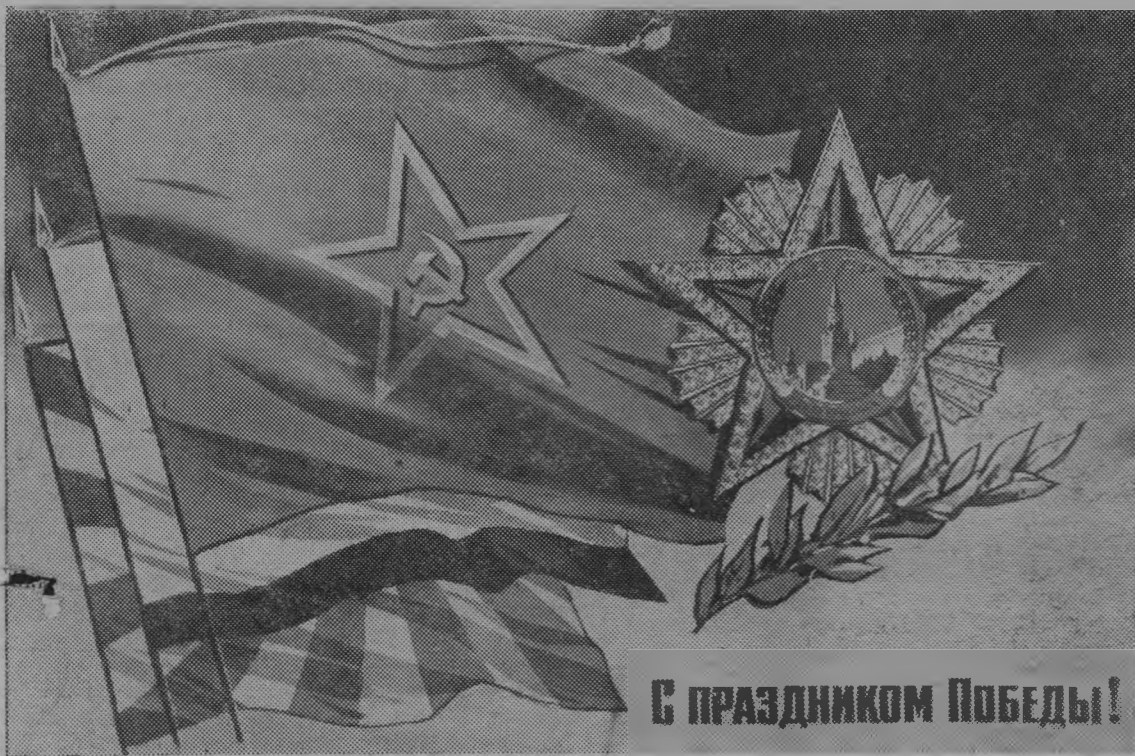
Плакат художника В. Викторова. Издательство "Плакат".