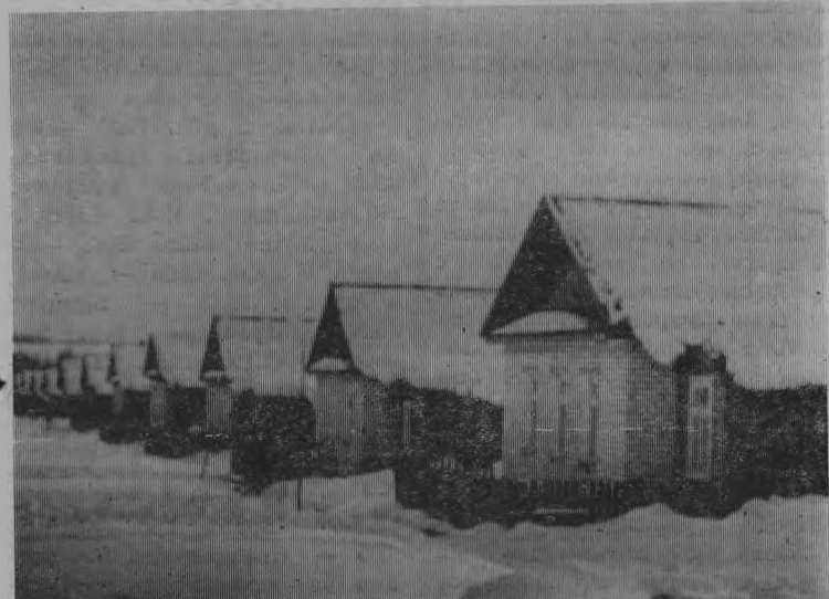
НА УЛИЦЕ МОЛОДЕЖНОЙ.

В правлении колхоза мне назвали такие цифры: только за минувший год влились в коллектив 53 новых работника: