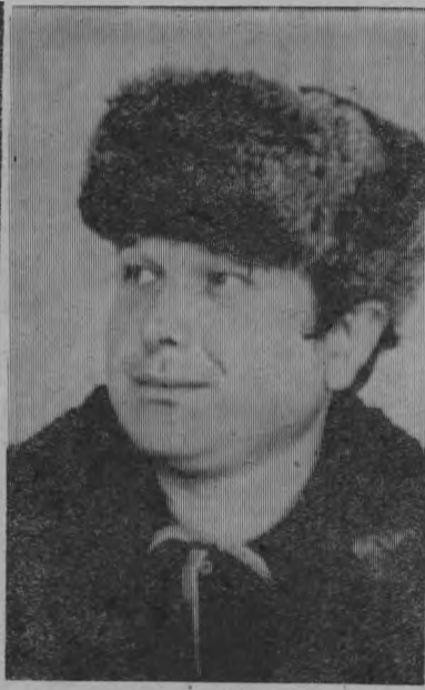
В дружном коллективе лесозаготовителей Арбинского лесопункта Пижемского лесопромхоза успешно трудится тракторист и он же бригадир