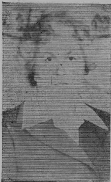
в Лесозаводской восьмилетней школе.

Ее партийный стаж — 17 лет. Коммунист постоянно ведет большую общественную работу.