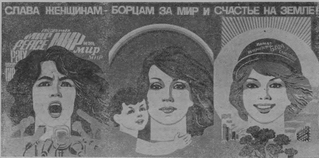
Плакат художников Л. Бельского и В. Потапова. Издательство «Плакат».

В этот праздник весны желаем счастья Вам, дорогие женщины, успехов в труде, хорошего здоровья и радости!