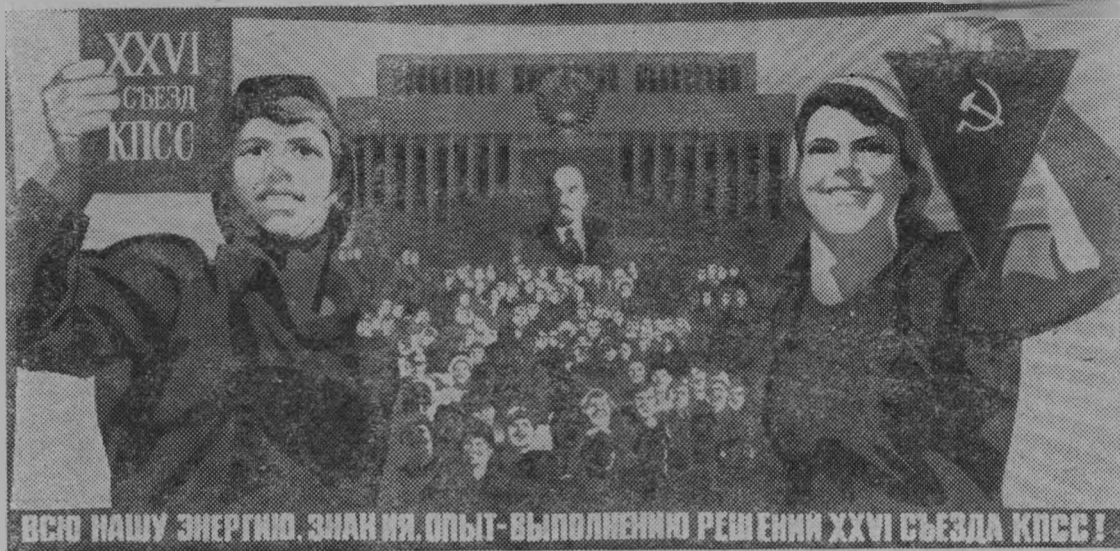
Плакат художника В. Конопова. Издательство «Плакат».