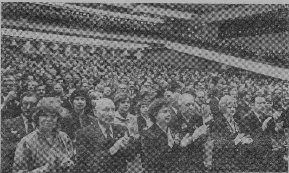
Москва. XXVI съезд КПСС. На снимке: в зале заседаний Кремлевского Дворца съездов.