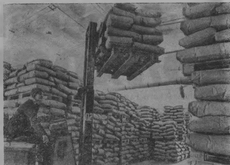
Ленинградская область. Животноводческие фермы получили первые тонны кормовых дрожжей с Киришского биохимического комбината. На этом крупнейшем на Северо-Западе страны предприятии вступил в строй комплекс по производству белковых концентратов. Его мощность — 20 тысяч тонн продукции.