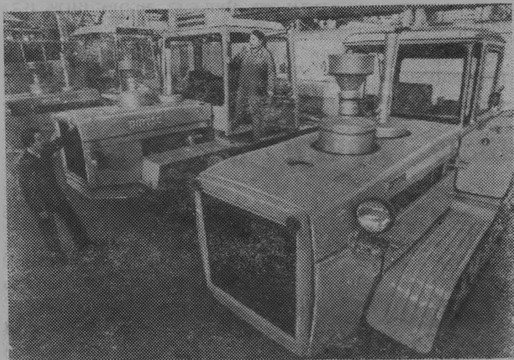
Волгоградские тракторостроители обязуются ко дню откры-

тия XXVI съезда КПСС собрать несколько тракторов «ДТ-75С»