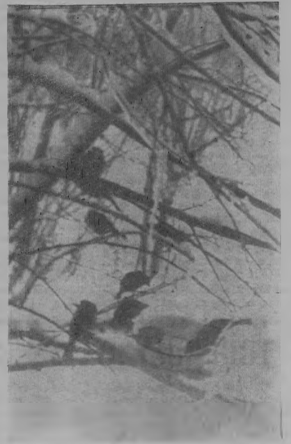
У кормушки.

— лучше не надо! — Ух, ты!, — восклицаю! Давай сообразим ради такой встречи. Скинемся по рублику — другому. Он было выпнул из кармана итерку, но, немного подумав, сунул ее в копилку, что на заднем сиденье лежала. — Здесь, — говорит, — целее будет. Тогда и я вдруг задумался: может, и мне такую же копилочку завести? В. ПАЕВ.