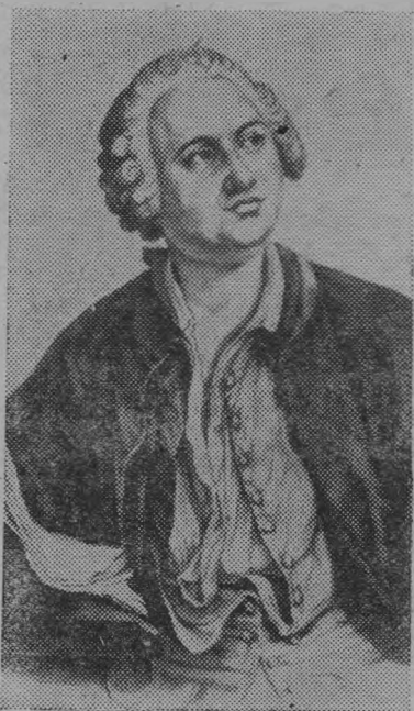
Русский просветитель, ученый-энциклопедист, поэт М. В. Ломоносов.

К 270-летию со дня рождения (1711—1765) М. В. Ломоносова.