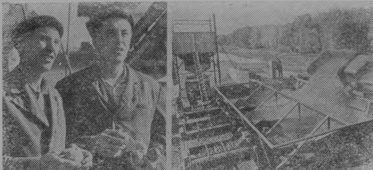
Сотни тонн картофеля получают ежегодно в совхозе «Азовский» Омской области. Сортировкой клубней здесь