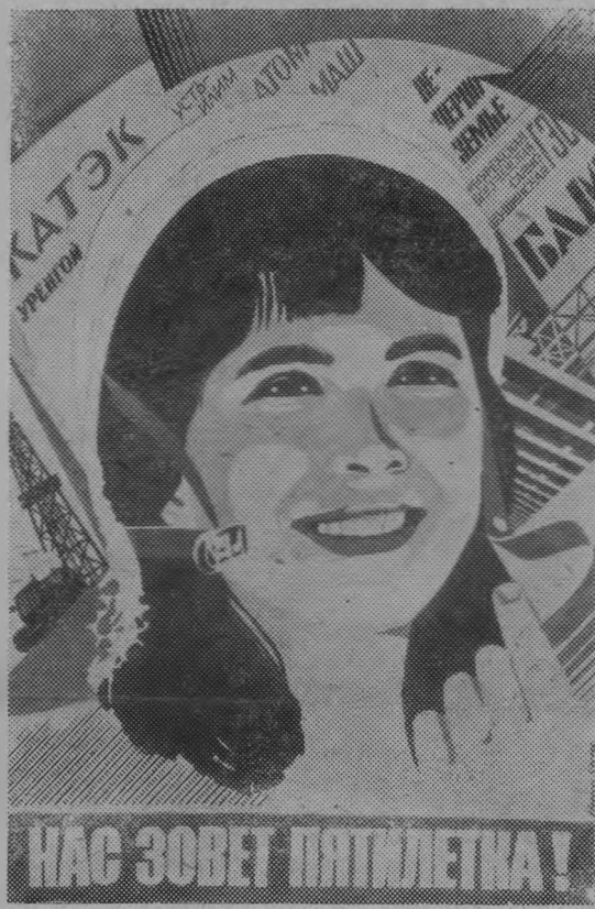
Плакат художников Л. Бельского, В. Потапова. Издательство «Плакат».