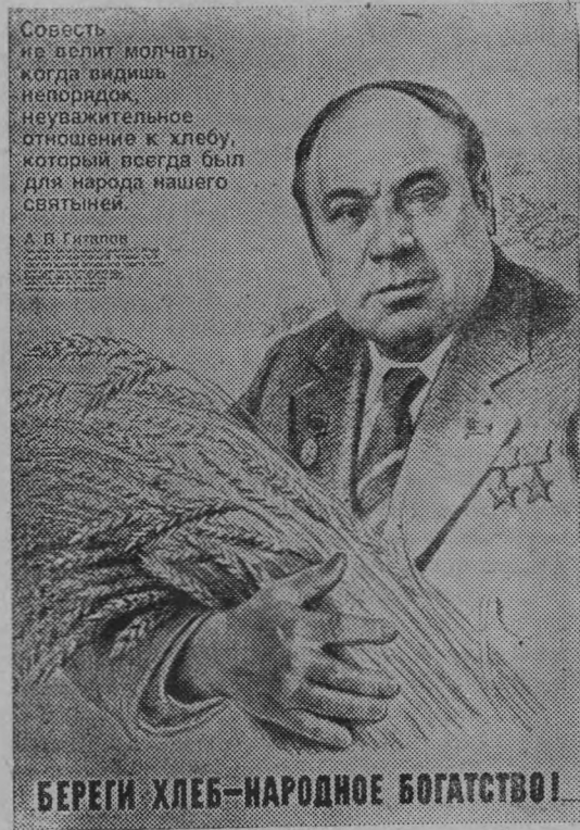
БЕРЕГИ ХЛЕБ — НАРОДНОЕ БОГАТСТВО!

«Береги хлеб — народное богатство!» Плакат художника Ф. Войтова. Издательство «Плакат».