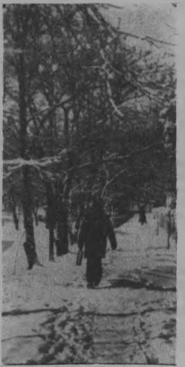
В зимнем парке.