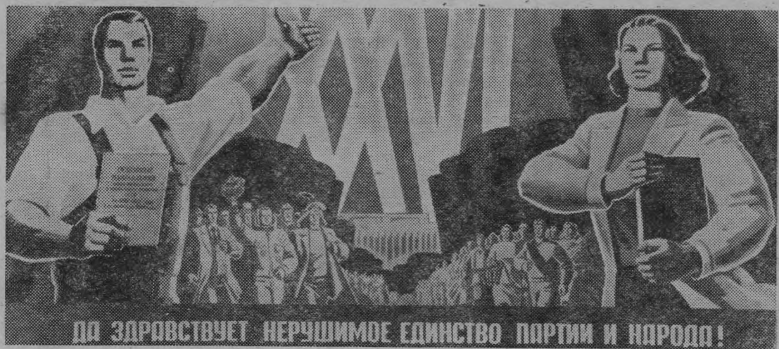
ДА ЗДРАВСТВУЕТ НЕРУШИМОЕ ЕДИНСТВО ПАРТИИ И НАРОДА!

Плакат художника З. Смехова «Да здравствует нерушимое единство партии и народа!» Издательство «Плакат».