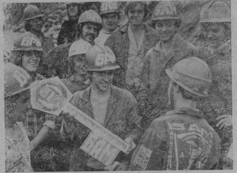
«Граждане СССР имеют право на труд». (Статья 40 Конституции СССР).

Все длинее становится железнодорожная линия Байкало-Амурской магистрали. Строители БАМа полны решимости выполнить задание XXVI съезда КПСС: в теку-