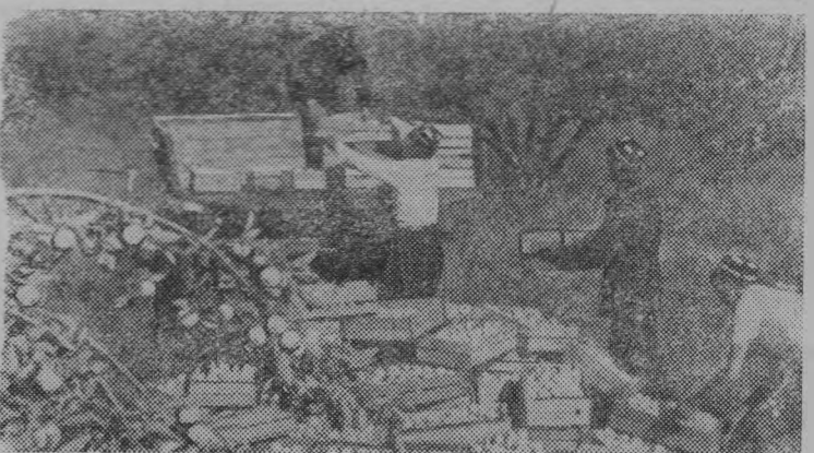
Бухарская область. Сбор яблок в Шафирканском лесхозе (на снимке). Оазисом в пустыне называют эти сады, разбитые на площади 48 гектаров, отвоеванных у знойных Кызылкумов. Ежегодно сады дарят людям более 50 тонн ароматной продукции.