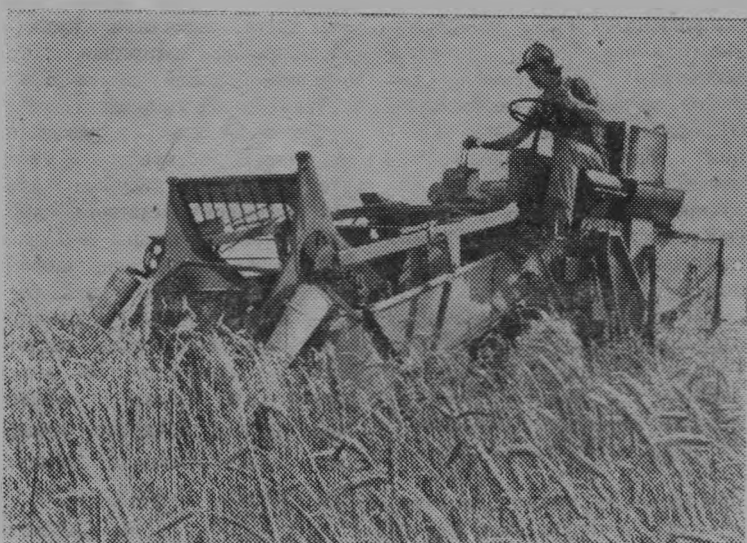
Московская область. Свыше четырех миллионов гектаров в нашей стране засеваются сортами зерновых культур, выведенными в Научно-исследовательском институте сельского хозяйства центральных районов Нечерноземной зоны РСФСР.