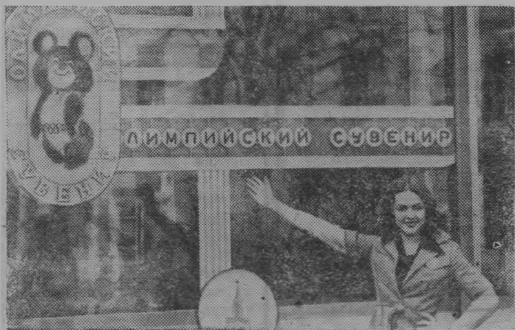
Столичный магазин «Олимпийский сувенир» пользуется большой популярностью у жителей Москвы и ее гостей.

Коллектив магазина подготовился к всемирному спортивному форуму: продавцы занимались на курсах иностранных языков, прошли специальную программу по подготовке к Играм. Ведь во время Олимпиады посетителями магазина стали спортсмены и многочисленные туристы из разных стран мира.