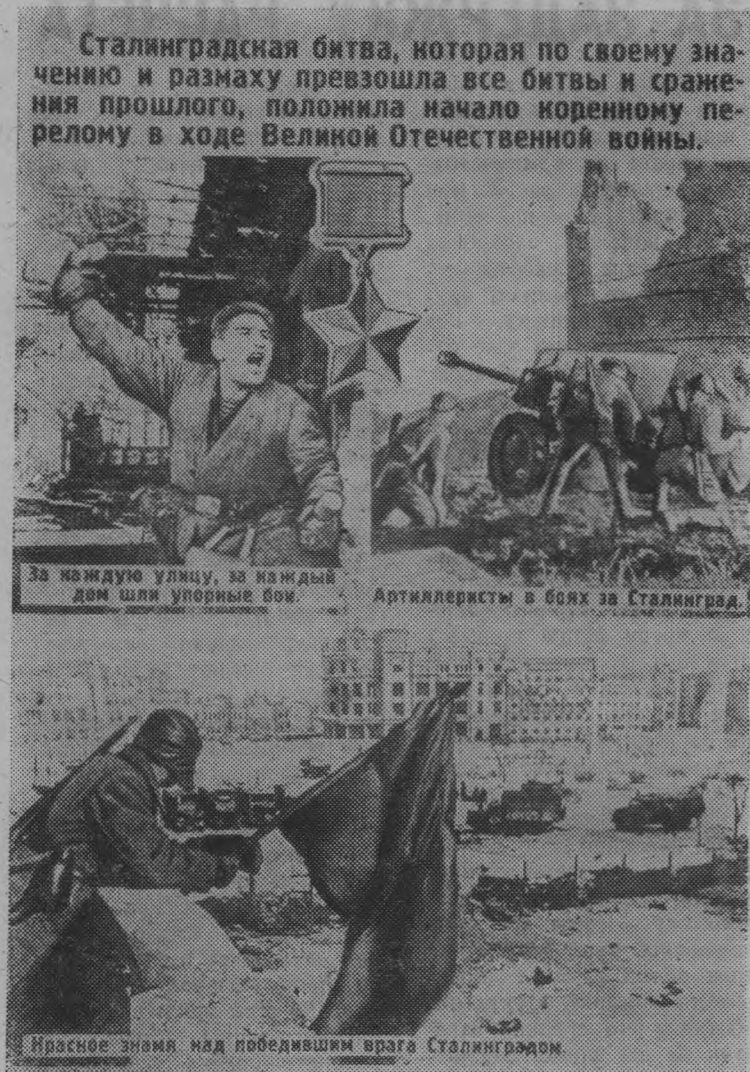
Сталинградская битва, которая по своему значению и размаху превзошла все битвы и сражения прошлого, положила начало коренному перелому в ходе Великой Отечественной войны.