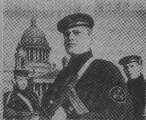
Моряки с крейсера «Октябрьская революция» патрулируют улицы города на Неве.

«Дорога жизни», проложенная по льду Ладожского озера, связывала Ленинград с «большой землей».