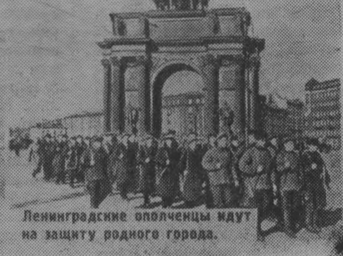
Ленинградские ополченцы идут на защиту родного города.

Моряки с крейсера «Октябрьская революция» патрулируют улицы города на Неве.