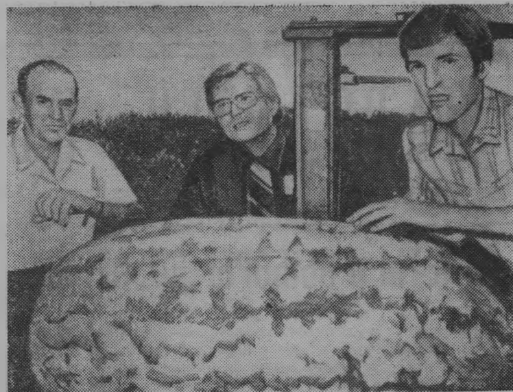
США. Этот огромный арбуз весом более 90 кг вырос на одной из ферм в штате Арканзас.