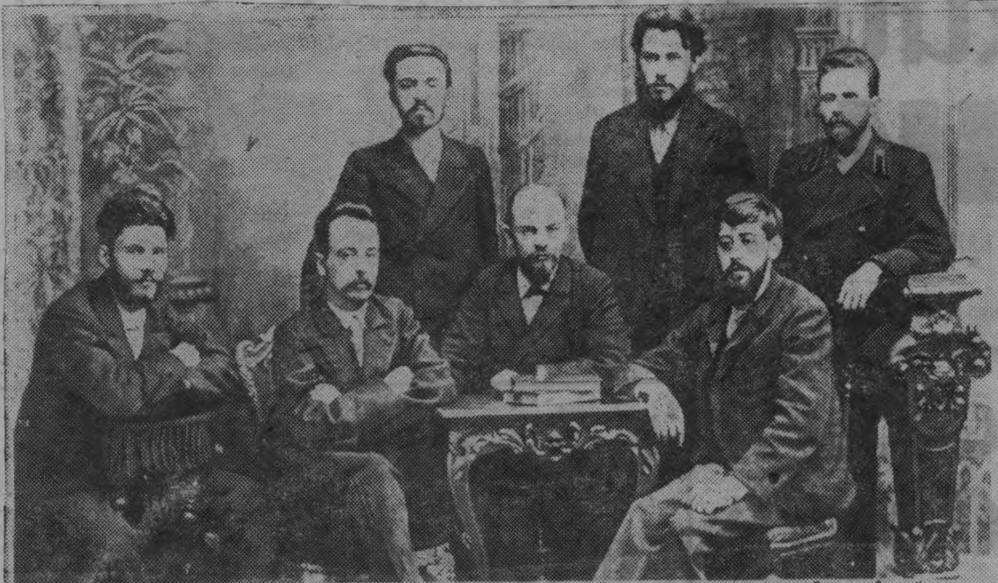
В. И. Ленин среди членов «Союза борьбы за освобождение рабочего класса», 1897 г.

Решающую роль в формировании Владимира Ильича как вождя революционного пролетариата России сыграла его деятельность в Петербурге.