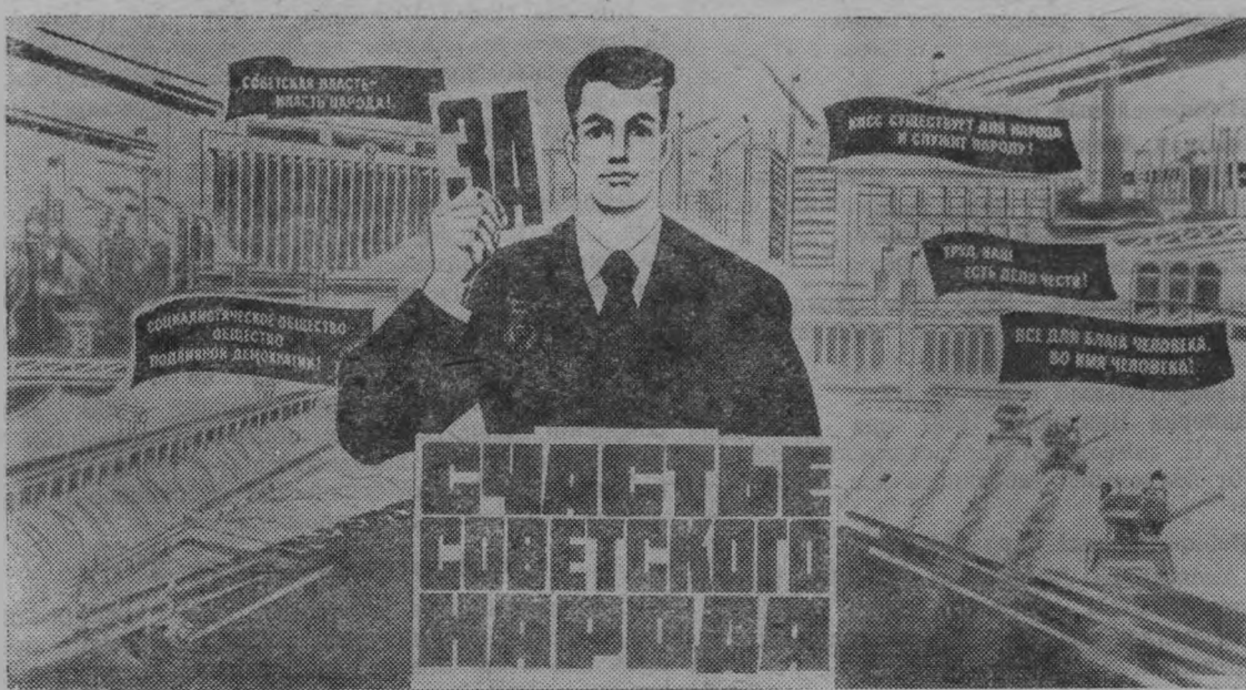
Плакат художника Б. Решетникова «За счастье советского народа». Издательство «Плакат».

В том числе депутатов: мужчин — 171, или 49,5 процента, женщин — 174, или 50,5 процента, членов и кандидатов в члены КПСС — 122, или 35,3 процента, беспартийных — 159, или 46,0 процентов, рабочих — 133, или 37,9 процента, колхозников — 90, или 26,1 процента, молодежи до 30 лет — 110, или 31,8 процента, членов ВЛКСМ — 67, или 19,4 процента. Состав депутатов обновился на 39,4 процента.