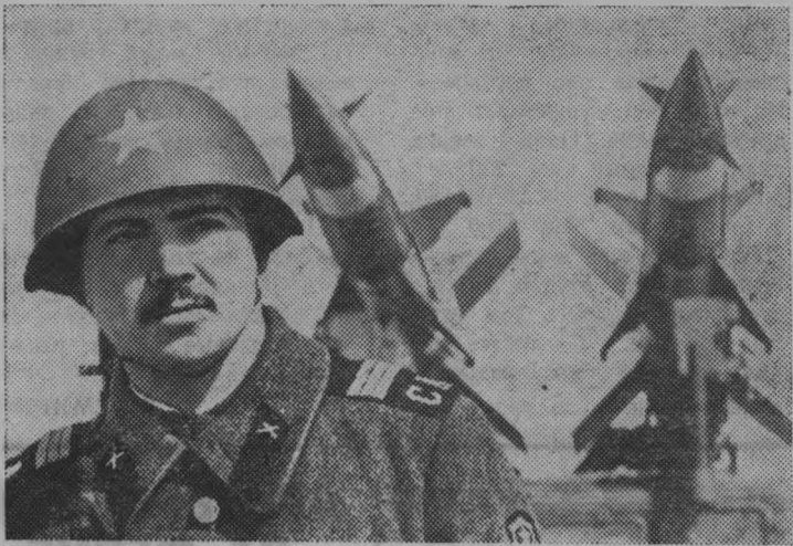
На страже Родины.