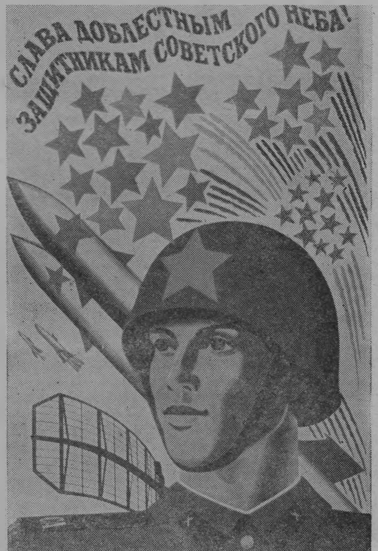
Плакат художника М. Лукьянова. Издательство «Плакат».