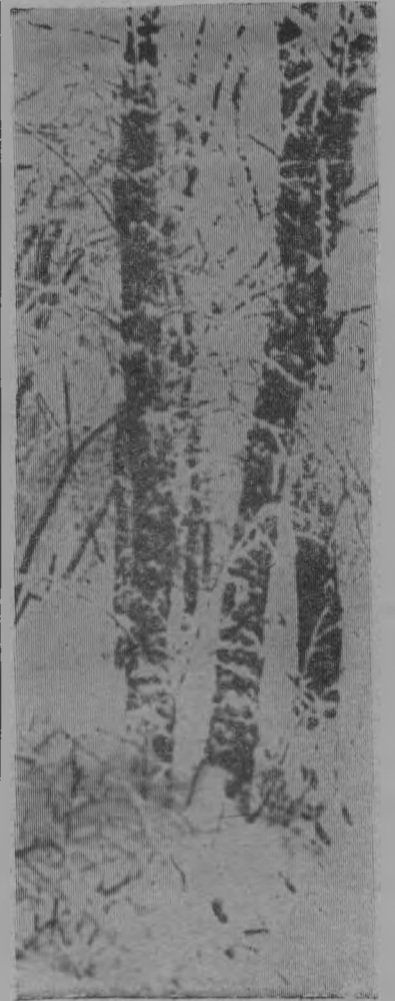
Первый снег. Фотоэтиюд М. Шумайлова.