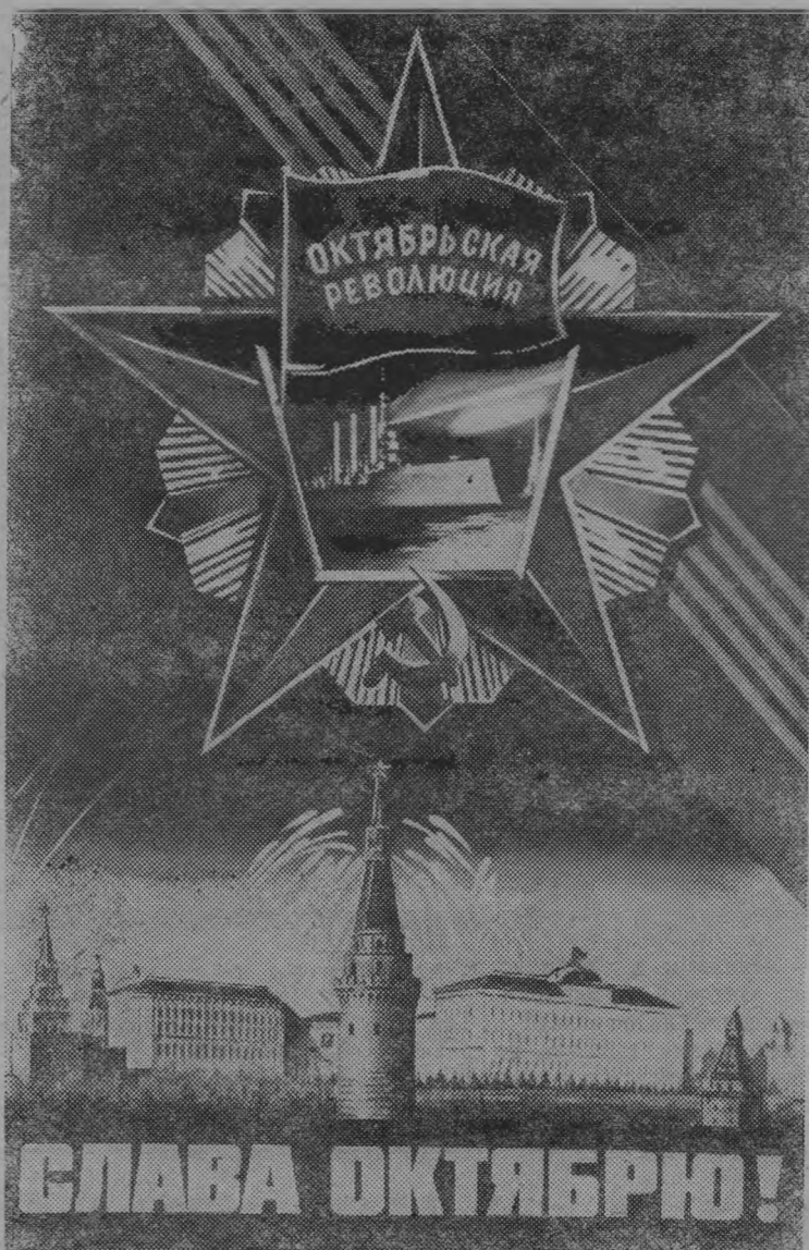
Плакат художника В. Викторова, Издательство «Плакат».

Успехов тебе на пути твоём, наша многонациональная Отчизна!