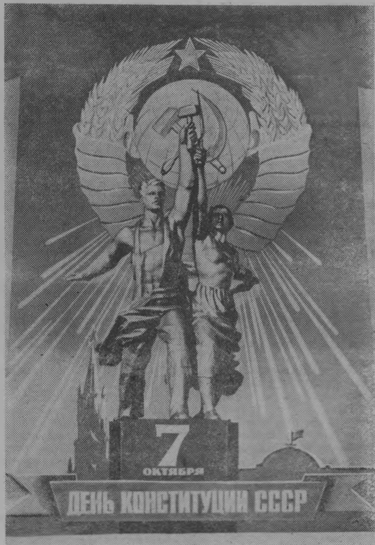
Плакат художника В. Викторова. Издательство «Плакат», Фотохроника ТАСС.

Конституция окажет сильнейшее влияние на укрепление международных позиций социализма, послужит мощным стимулом, вдохновляющим примером в борьбе трудящихся всего мира за свободу, демократию и прочный мир.