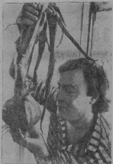
900 граммов — таков вес необыкновенной луковицы, выращенной в одном из сельских районов недалеко от города Вильбао (Испания).