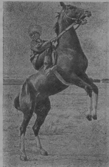
Ахалтекинцы, знаменитая порода лошадей, славятся своей выносливостью, красотой и резвостью. Родиной их стала территория нынешнего Туркменистана, а точнее — предгорья Копет-Дага.

В. ЛОБАНОВ, главный инженер райсельхозуправления.